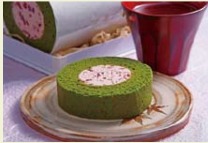
かのや深蒸し茶部門・専門家の部グランプリ作品