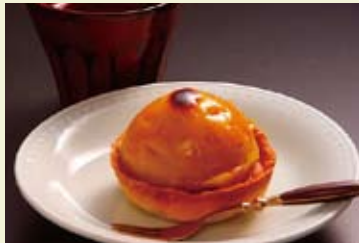
かのや紅はるか部門・一般の部グランプリ作品

あります。イベントで焼き芋にすると飛ぶように売れていくんですよ。「かのや深蒸し茶」は昔から独特の強蒸しで作られていましたが、知名度がいまひとつ。ただ先日テレビで「ガンの死亡率が低いお茶の生産地」と鹿屋が紹介されてから、問い合わせが増えました。最近では中食ブームで家庭における食材そのものの消費量は減っています。ならば加工品として広めていく方法を探ろうと開催したのが「スイーツコンクール2011」です。応募は250点。技術や創意・工夫など専門的審査のほか、「見た目を決める」美スイーツ賞を設け、市役所ほか携帯電話やパソコンでも多くの人が気軽に投票できるよう工夫しました。入賞者は11月27日の農業まつりで表彰されます。知恵と汗を出し合って実施したイベントは一過性で終わらせたくはありません。菓子業界や外食産業、コンビニエンスストアにも審査員として協力をいただき、最終的にはお土産物やデザートとして商品化を目指します。