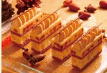
かのや紅はるか部門・専門家の部グランプリ作品